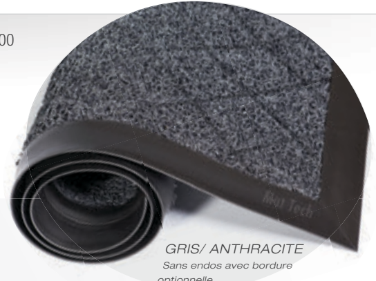
GRIS/ ANTHRACITE Sans endos avec bordure optionnelle