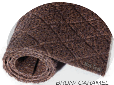
BRUN/ CAMEL Sans endos