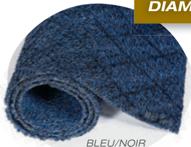
BLEU/NOIR Sans endos