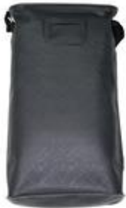
Accessory Bag / Sac pour accessoires