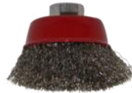
Steel brush 2" / Brosse Acier 2"