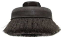
Steel brush 3" / Brosse Acier 3"