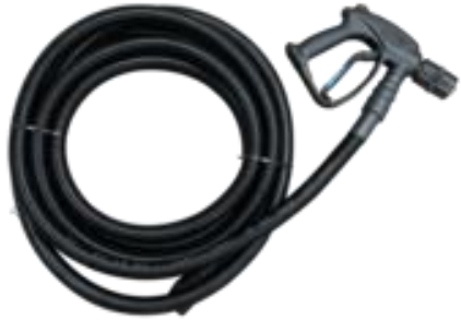
Hose / Boyau