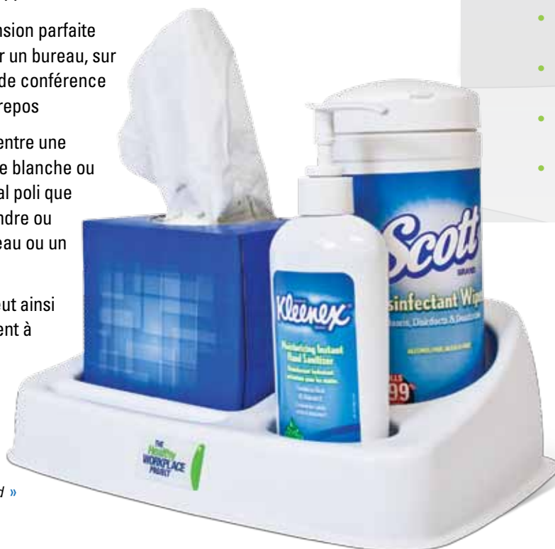
Corbeille individuelle standard »