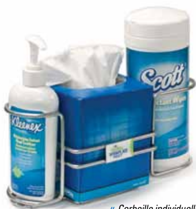
« Corbeille individuelle de luxe »