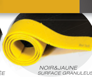
NOIR&JAUNE SURFACE GRANULEUSE