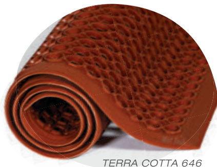
TERRA COTTA 646

POUR PLUS D'INFOS: mattech.ca/tuffspun-fr