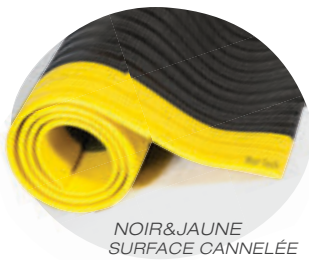
NOIR&JAUNE SURFACE CANNELÉE