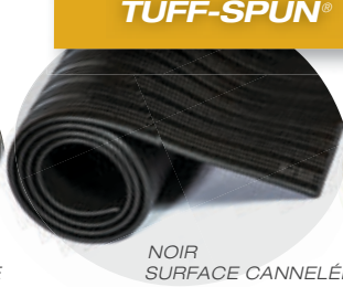
NOIR SURFACE CANNELÉE