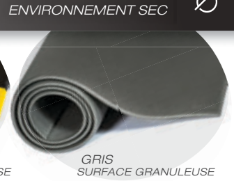
GRIS SURFACE GRANULEUSE