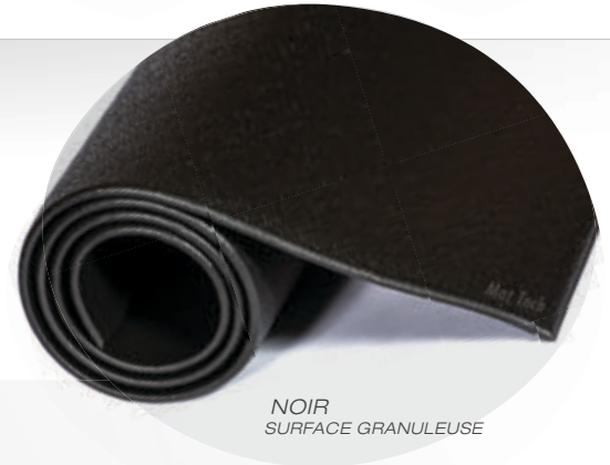
NOIR SURFACE GRANULEUSE