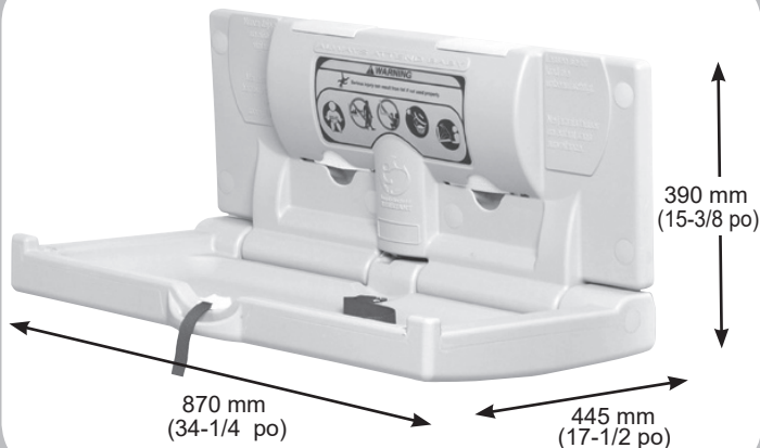
Table à langer horizontale Modèle 100-EH 5210089