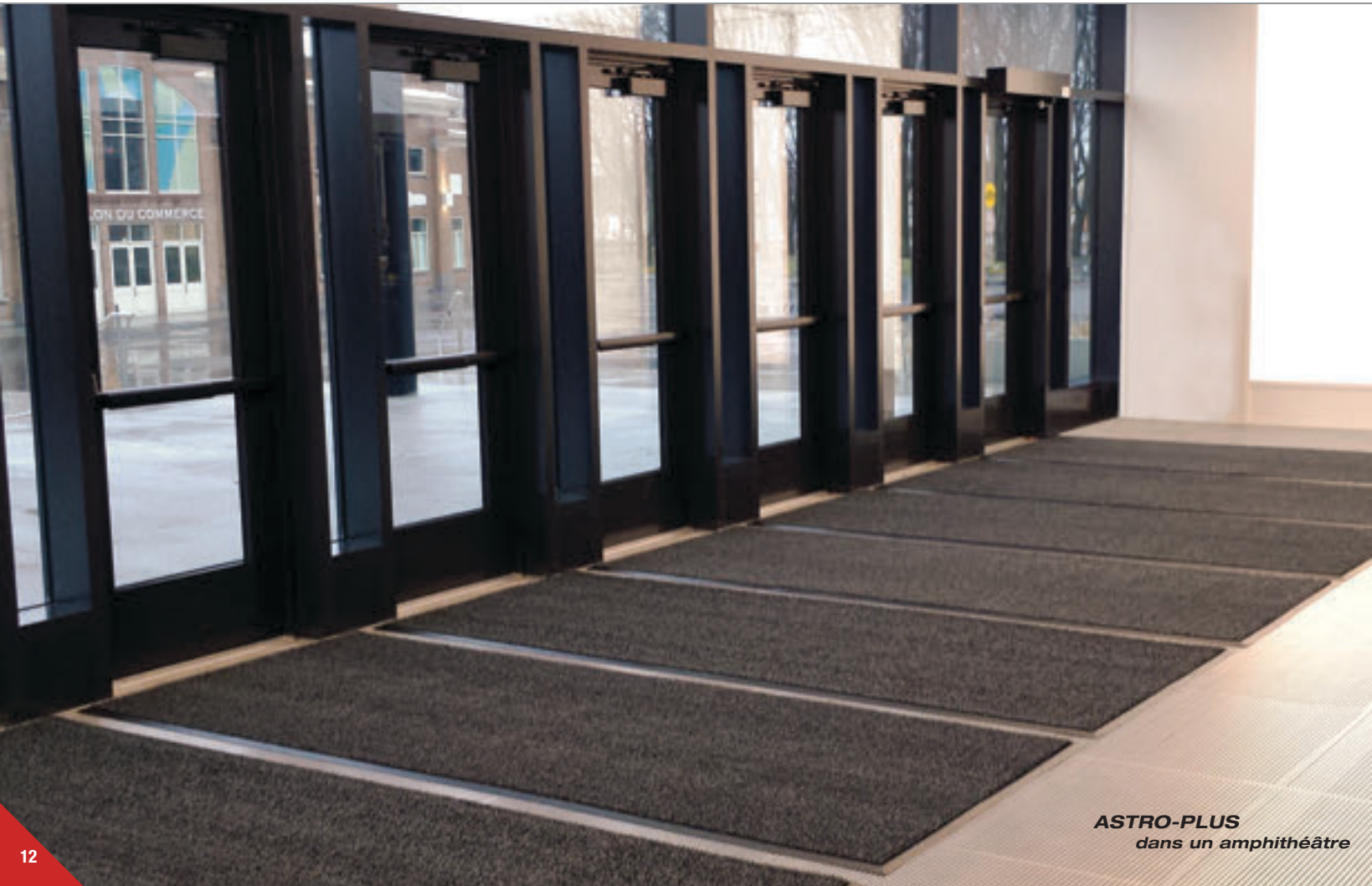
ASTRO-PLUS dans un amphithéâtre

POUR PLUS D'INFOS: mattech.ca/duststar-fr