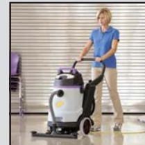
Décapage de plancher