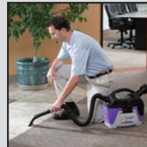
Intervention d'urgence en cas de déversement