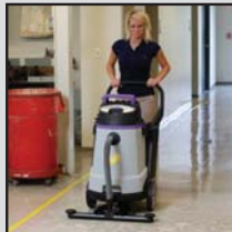
Conditions météorologiques extrêmes