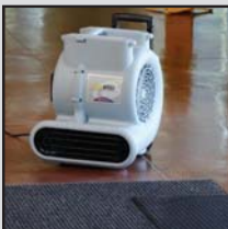
Entrée/ Tapis d'entrée