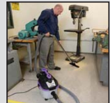
Entretien sur chantier

Tuyau éclaté, bataille de nourriture, traces de boue, inondation, décapage des planchers... voici une solution d'urgence.