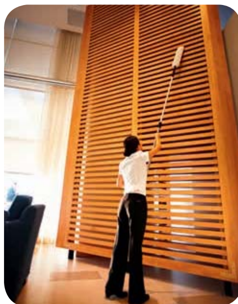
Connectez le manchon de dépolluage flexible aux manches télescopiques (voir page 63).